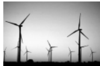
1. ( Honrrubia)